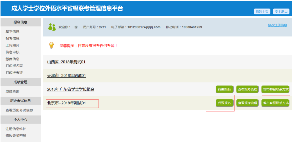
( 图 2.1-3 )