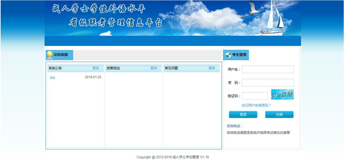
( 图 2.1-2 )

用户打开浏览器，在网址地址栏处输入 ( http://xsxw.ks365/stu )，打开登录页面，然后输入正确的用户名和密码、验证码即可 ( 用户名和密码由考生自行注册创建 )，如图 2.1-2 所示：